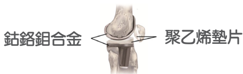
圖二、部分人工膝關節置換術