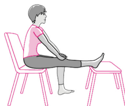
矯正膝關節彎縮 (壓膝運動)