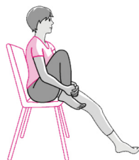
增加關節活動度 (抱膝運動)