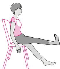
維持大腿肌力 (直抬腿運動)

建議手術前即可執行復健運動，更有助於手術後恢復。手術後也應持之以恆執行護膝三運動，作為膝關節保健的基石