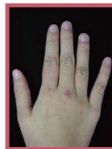
◀ 手部伸側關節處紅疹