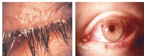
眼睛乾燥結膜發炎