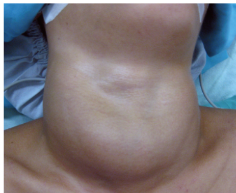
圖二：甲狀腺機能亢進病人的外觀

體重減輕、容易飢餓、食慾增加、排便次數增加、易煩燥發脾氣、容易緊張、心跳加速、過度流汗、甲狀腺腫大(如圖二)、女性會月經異常、雙手濕熱而顫抖及眼睛病變(凸眼)、睡不著、失眠等症狀，嚴重時會引起心臟衰竭，甚至死亡。