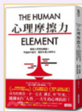
心理摩擦力: 尚塔爾 (Schonthal, David)