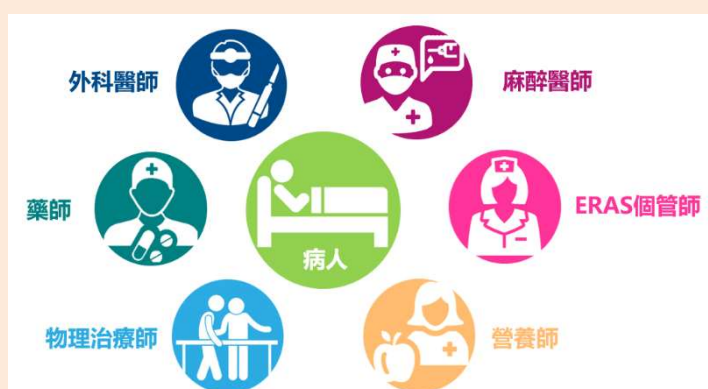
圖一：ERAS團隊成員基本組成，病人也是治療團隊的一份子

外科醫師發現老太太及家屬對於手術治療一直無法決定，也了解他們的困難點，於是請ERAS ( Enhanced Recovery After Surgery, 怡樂適 ) 個管師來協助病人進行重大手術術前準備，讓術後恢復狀況可以更安全也更順利，可以有效減少手術風險，讓病人及家屬安心的選擇手術治療。首先個管師為老太太進行「系統性風險評估-美國外科學院手術風險評估」( ACS Surgical Risk Calculator ) (Raymond et al., 2019)，同時把系統評估量表結果和病人家屬討論，同時將相關結果同步給ERAS團隊成員 (圖一)。